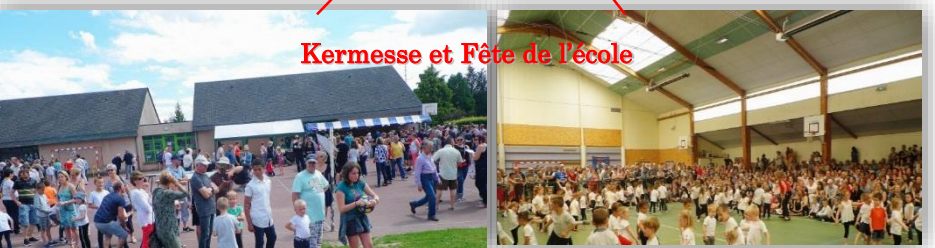
Kermesse et Fête de l'école