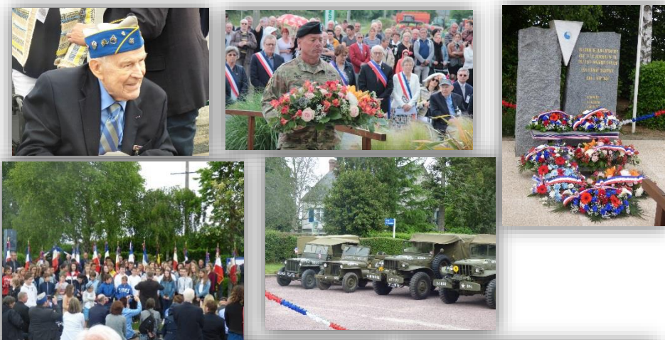
Cérémonies de libération de St Clair sur l'Elle, 13 juin

4 JUIN : CÉRÉMONIE DU 75 ème ANNIVERSAIRE DU DÉBARQUEMENT