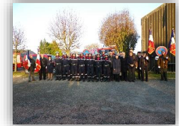
Passation de commandement Centre de secours